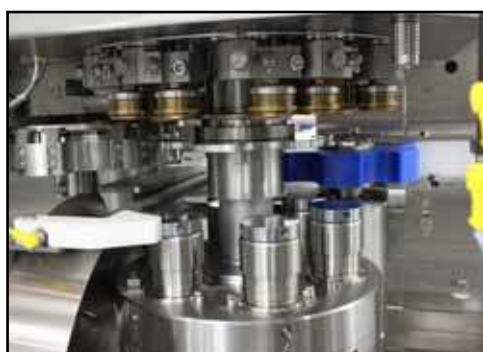
Zone de sertissage conçu selon spécification d'hygiène